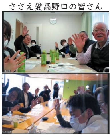
ささえ愛高野口の皆さん

今回の交流で、お互いが刺激となり、定期的な交流に繋がっていくことを願っています。