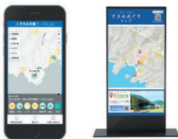
観光・防災ポータル

4月14日にすさみスマートシティ推進コンソーシアムが、これまで実施したスマートシティ関連事業の報告会を行いました。報告会には、町幹部職員や関係事業者ら約40人が出席し、観光・防災ポータルの活用やドローンでの救援物資配送、災害備蓄品のデジタル管理、3Dマップ等についての報告説明が行われました。