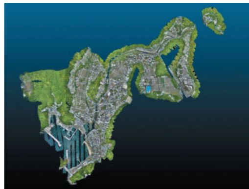
ドローンで作成した3Dマップ

すさみ町は、今後もデジタル技術等の活用により、様々な課題解決を目指して参りますので、引き続き町民の皆さまのご協力をお願いいたします。