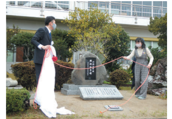
閉校記念碑除幕式

3月26日に江住小学校の閉校式と150周年記念式典が行われました。児童や保護者、地域の方や先生方など約200名の方に見守られながら、150年の歴史に幕を下ろしました。