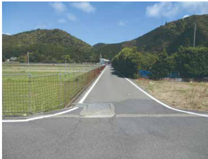
立野西部地区農道2号線

問 県道よりもこの農道を通行することで近道となる方々の通行が増えていく。また農道と知らずに一般道との認識で通行する人も多いように思う。この農道の拡幅や町道への昇格等の考えは。 答弁 町長 この農道だけを広げても問題の解決にはならず、拡幅の考えはありません。一番最後の出口まで拡幅する計画であり、現状のまま県道へ誘導する方法を考えてみたい。