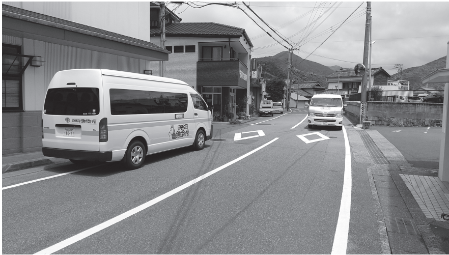
(公共交通・コミュニティバス)

とも改善し、町民の皆さんの外出を支援していただきたいが。 答弁 町長 ご意見等にもできるだけ対応しながら、外出支援をしてまいりたいと考えています。