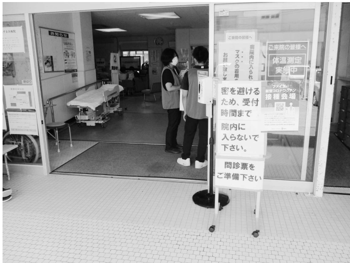
(ワクチン接種会場)

答弁 町長 県条例を補完したような条例なら作つたらいいのではないか。海水浴場の駐車場などキャンプやバーベキューを禁止する場所を明確にし畳1枚程の看板を立てしっかりと巡回、管理をして参ります。人に迷惑をかけずマナーを守って楽しんでもらえるよう誘導や指導をして参りたい。