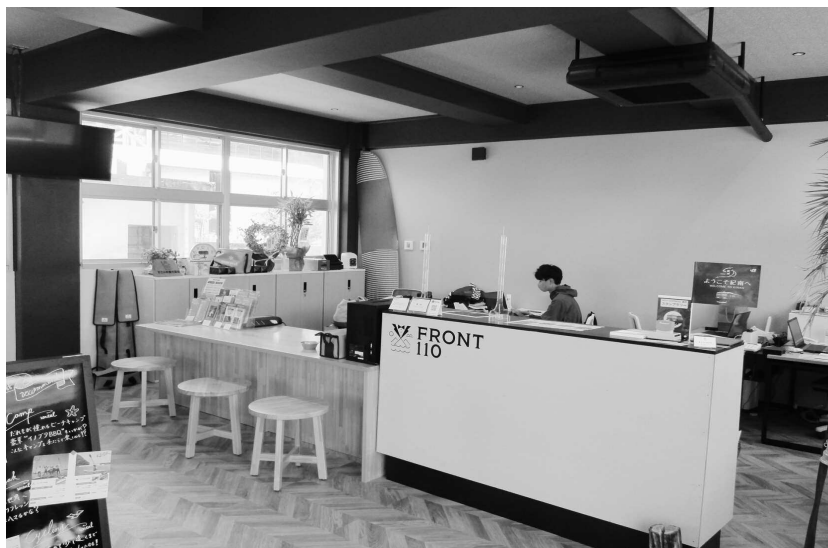
(観光案内所フロント110)