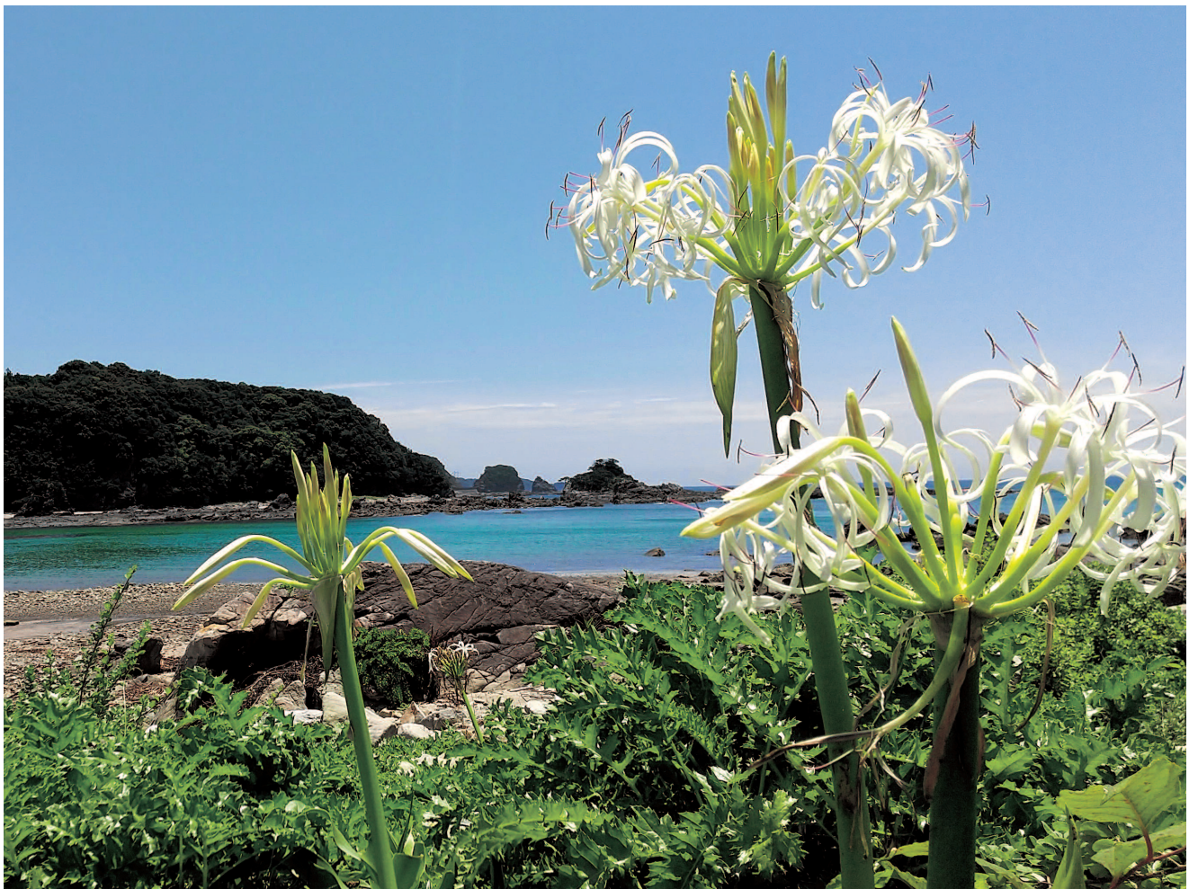
里野の浜ハマユウ