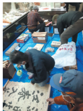
古文書の保存作業

本館運営委員会では、この古文書の保存方法の改善が懸案となっていました。2月7日に、県教育庁文化遺産課保存班と県立図書館の方々の指導を受けながら運営委員会との共同作業で、古文書の状態を確認し、整理、保管作業を行いました。