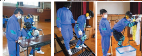
コップに水を入れる 段差を下りる 洗濯物を干す