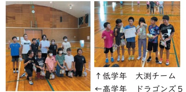
↑低学年 大漕チーム ←高学年 ドラゴンズ5