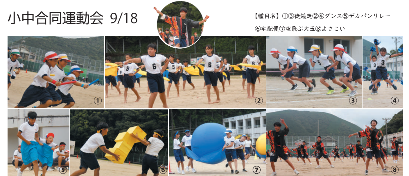
【種目名】①③徒競走②④ダンス⑤デカパンリレー ⑥宅配便⑦空飛ぶ大玉⑧よさこい

今年もコロナの影響で、観客数を調整しての開催でしたが、子どもたちは元気いっぱい各種目に取り組みました。