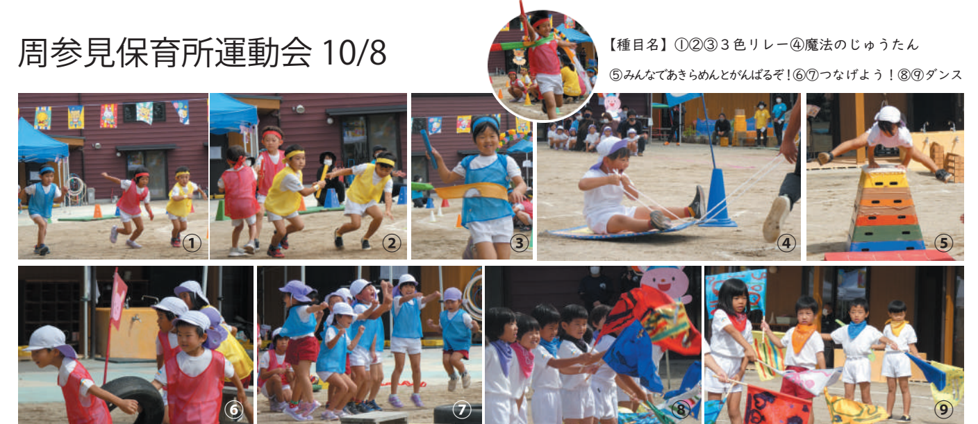
【種目名】①②③色リレー④魔法のじゅうたん ⑤みんなであきらめとがんばるぞ！⑥⑦つなげよう！⑧⑨ダンス