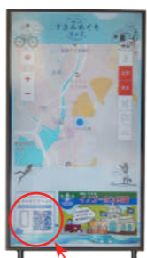
すさみめぐりマップは こちらの二次元コードから