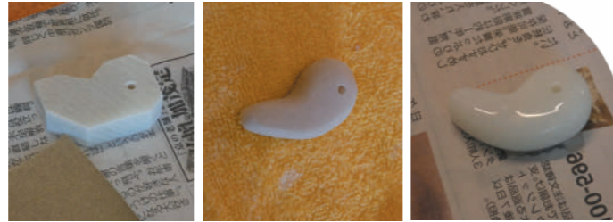
削る前の蠟石 → 削り中 → 完成

紀伊風土記の丘の方のご指導のもと、ろうせきを削って勾玉をつくりました。手が真っ白になりながらも紙やすりで熱心に勾玉を磨きました。