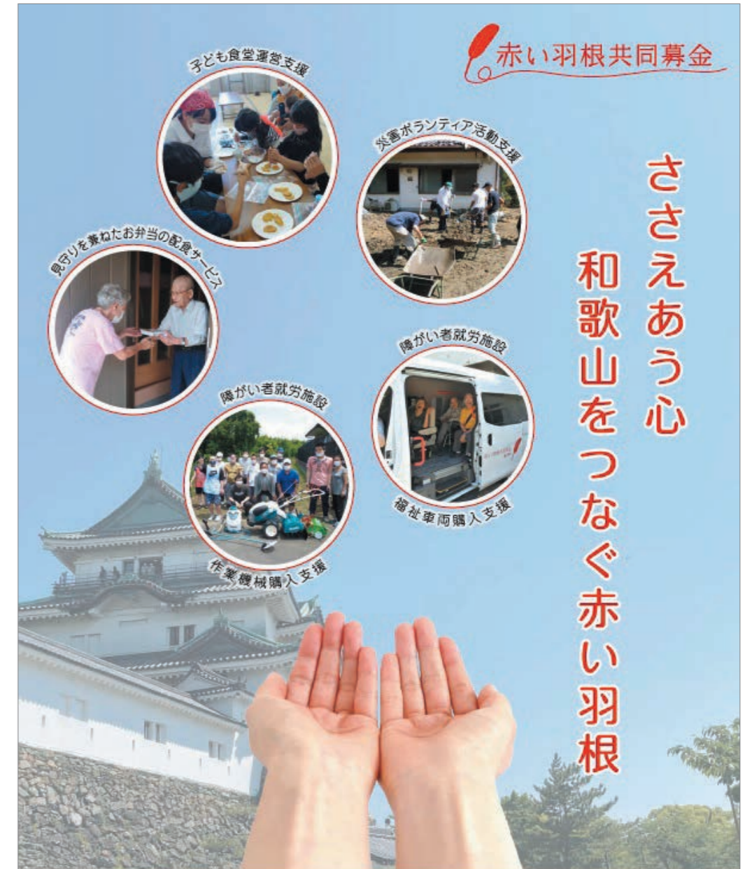
子ども食堂運営支援