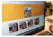
AI×プログラミングでレジを作ろう