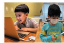
小中学校で特別授業 ITに触れて学ぼう