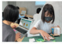
模様やパーツ並べ ルームランタン作り