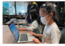
プログラミングでミニゲームを作ろう