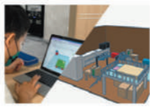
3DCGに挑戦！ 家具をデザインしよう