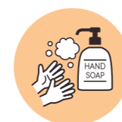
石けんでの手洗い